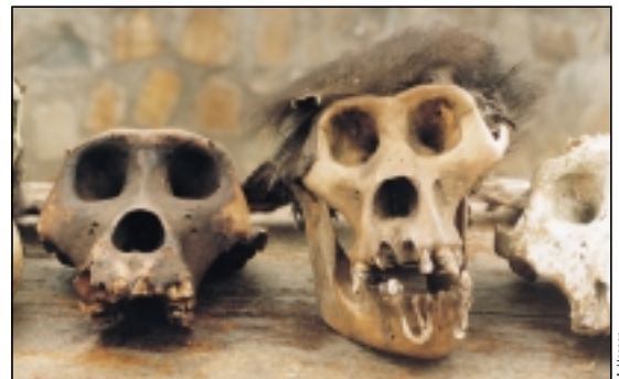
Viele an Menschen gewöhnte Gorillas wurden in der DR Kongo getötet.

Seit 1997 herrscht in dieser Region Bürgerkrieg. Das Nationalparkpersonal wurde während dieser Zeit überhaupt nicht bezahlt. Milizen raubten die Ausrüstung der Wildhüter, und durch das Militär wurden sie entwaffnet, so daß sie den oft gut ausgestatteten, organisierten Wildererbanden nichts entgegenzusetzen hatten.