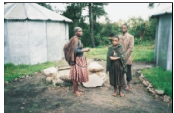
Hunger ist ihr größter Feind.