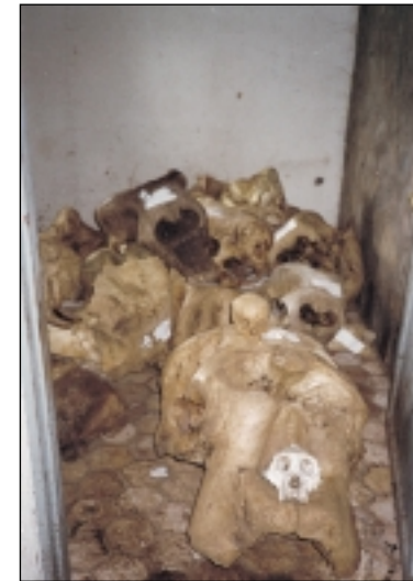
Diese Schädel stammen von Tieren, die im Nationalpark gewildert wurden. Und manchmal findet man auch andere Opfer.