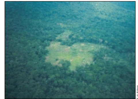
Rinder und andere Haustiere werden zum Weiden auch illegal in Nationalparks getrieben.

Die Haltung von Rindern und anderen Haustieren zur Fleischproduktion ist in vielen tropischen Gebieten wegen der dort lebenden Tsetse-Flye und anderer Parasiten nicht möglich.