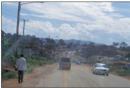
Kampala, die Hauptstadt Ugandas, ist der größte Wachstumspol des Landes.

Gegenüber den momentan sinkenden Geburtenraten und dadurch gleichbleibenden Bevölkerungszahlen in Deutschland ist der Bevölkerungszuwachs mit 2,5-3% in West- und Zentralafrika recht hoch . Bei verbesserter medizinischer Versorgung sinkt dort die Sterberate, doch kulturell-religiöse Einstellungen verhindern eine wirksame Geburtenkontrolle. Diese Entwicklung ist generell mit sinkendem Lebensstandard verbunden.